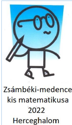
Zsámbéki-medence kis matematikusa 2022 Herceghalom

Tisztelt Intézményvezető Kolléga! Kedves Versenyzők!